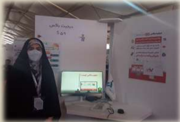
تیم دیجیت باکس