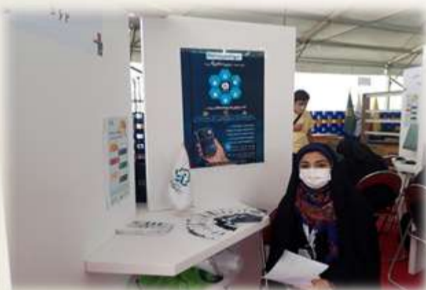
تیم همایش یار